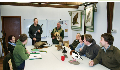
Ausbildung in der Waldschule Hohenstein (Witten)