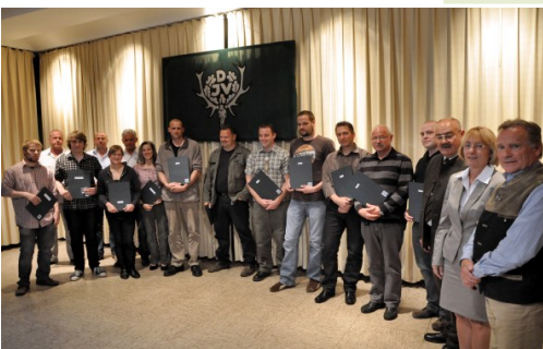
Mai 2010: Übergabe der Briefe an die Jungjäger

■ Die hohe Erfolgsquote spricht für den Kurs der KJS-EN!